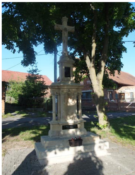
Ve Skršicích proběhla celková rekonstrukce křížku a zvoničky