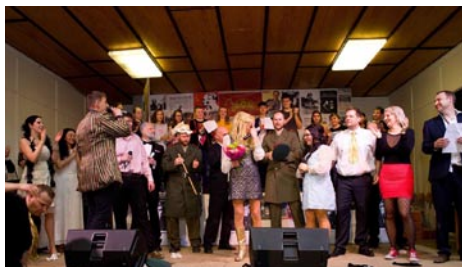
ŠVIHÁCI aneb KABARET U ZLATÝCH KŮZLAT