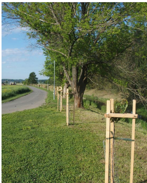
Na jaře vznikla třešňová alej na břehu řeky Dědiny u ČOV