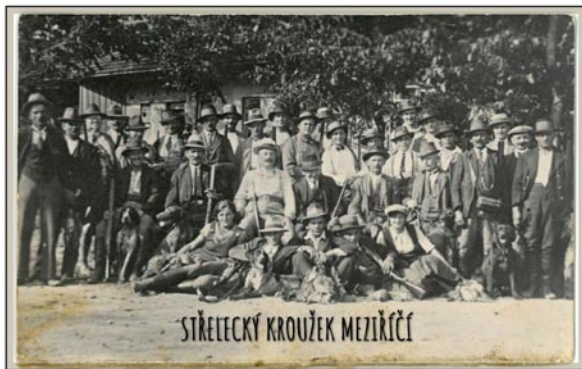
Členové Střeleckého kroužku před býv. hospodou na Malém Meziříčí (dnes Smídovo, čp. 160 u kruhového objezdu)

A to jsme se již z historie posunuli do současnosti. V roce 2013 se členové z Pohoří rozhodli, že si vytvoří vlastní honitbu a po dohodě se osamostatnili. Tím vznikl Myslivecký spolek České Meziříčí sdružující členy z Českého Meziříčí a Rohenic. Aktuálně v roce 2020 má tedy náš spolek 24 členů. Myslivci z našich obcí jsou velice aktivní při pořádání různých akcí, které vycházejí z myslivosti. Většina místních již navštívila každoroční Myslivecký bál, který je obdobou plesové sezony pro České Meziříčí a okolí. Vy-