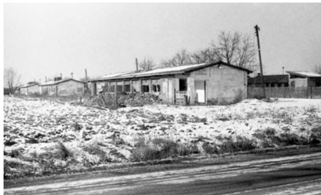
Pohled na bývalé zemědělské objekty ze Zahumenské ulice

Začátky kuželkářského spolku v naší obci můžeme datovat do roku 1984, kdy se sportovníji založení členové tehdejšího JZD „Svornost“ (později DUKLA) zúčastnili Zemědělské olympiády v Týništi n. Orlicí a Turnaje přátelství v Třeběchovicích. Zde asi dozrála myšlenka mít doma v Meziříčí vlastní kuželkářský klub a vlastní hernu. Vedení zemědělského družstva Svornost vyšlo těmto snahám vstříc a nabídlo objekt bývalé drůbežárny k přestavbě a adaptaci na hernu. 31. ledna 1985 dostal projekt vypracovaný Ing. J. Hajzerem „zele- nou“ s tím, že stavba kuželny proběhne svépomocí a brigádnicky členy nově založeného Klubu kuželkářů. 9. února 1985 se uskutečnilo slavnostní zahájení stavby, počet členů do konce roku 1985 dosáhl rovnou třicítku. Členové klubu i jejich přátelé a kamarádi odpracovali