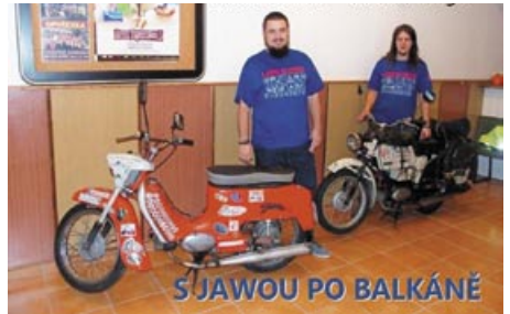
Beseda v kině 26. 11. 2018