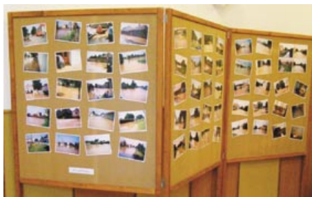
Výstava k 20. výročí povodně z 23. 7. 1998 v kině