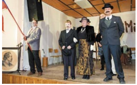
Divadelní hra „Vypukne to zítra“ 28. 10. 2018