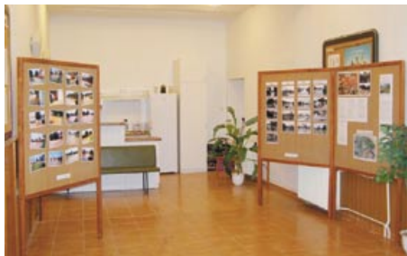
Výstava k 20. výročí povodně z 23. 7. 1998 v kině