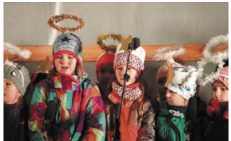
Rozsvícení vánočního stromu 2. 12. 2018