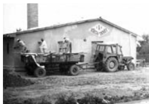
Ze stavby, 1986