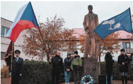
Slavnost u sochy TGM 28. října 2018