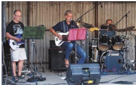
4. ročník Beatového festivalku pod kaštiny 11. 8. 2018