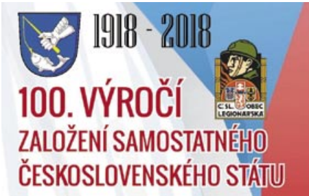
Oslava 100 let samostatného československého státu