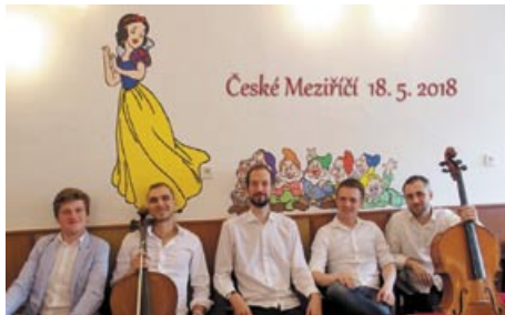
Koncert Prague cello quartet 18. 5. 2018 (pro ZŠ)