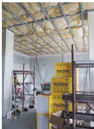
Stavební úpravy v nové knihovně, leden 2019