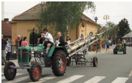
Stavění májky 1. 5. 2018