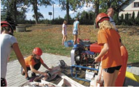
Hasičské loučení s létem 8. 9. 2018