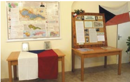
Výstava Meziříčtí legionáři a vznik republiky na OÚ