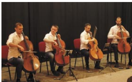
Koncert Prague cello quartet 18. 5. 2018 (pro ZŠ)