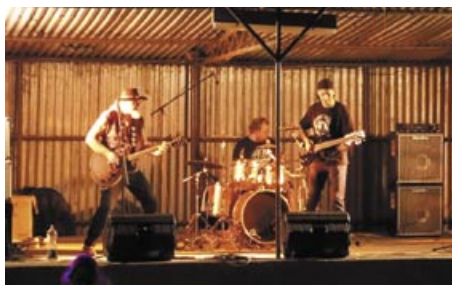
4. ročník Beatového festivalku pod kaštiny 11. 8. 2018