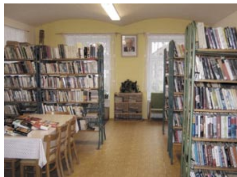
Knihovna v budově OÚ, 2010