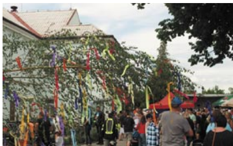
Stavění májky 1. 5. 2018