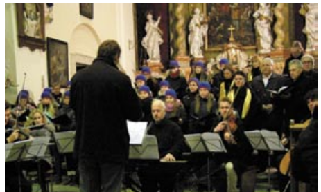
Rybova Česká mše vánoční v kostele 6. 12. 2018