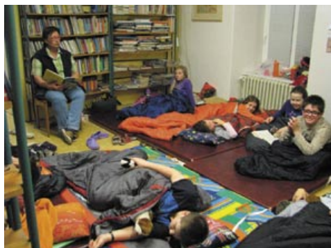
Noc s Andersenem 2014, knihovna v budově OÚ