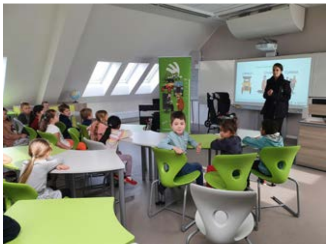
Přednáška v environmentální učebně

ŠKODA AUTO uspořádala 15. 3. v environmentální učebně přednášku pro žáky 1. až 3. třídy na téma Na silnici bezpečně, Cestující v autě a Chodec . Pro 4. až 9. třídy pak 17. - 18. 5. byla témata následující: Cyklista a viditelnost na silnici, V provozu bezpečně, Naše tělo a dopravní nehoda, Morální aspekt dopravní nehody a s tím související . Jednalo se o 45minutový program, při kterém byla shlédnuta videa a využita byla i interaktivní tabule.