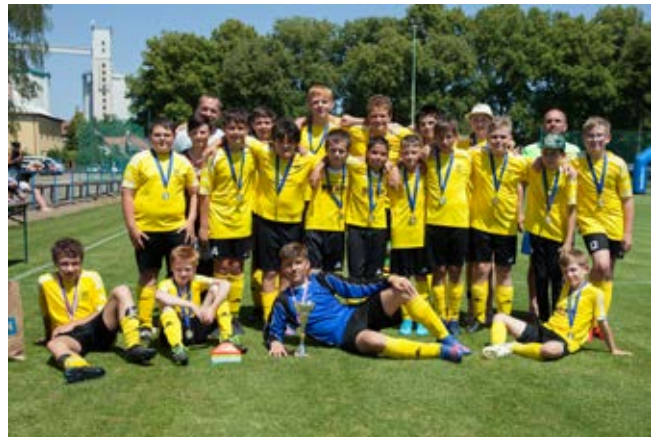
Mladší žáci, vítězové turnaje

Výbor FC České Meziříčí děkuje všem hráčům za skvělou reprezentaci klubu. Rodičům za to, že k nám dávají děti. Sponzorům za jejich podporu. A hlavně děkujeme našim trenérům mládeže, kteří se dětem ve svém volném čase věnují. Saki