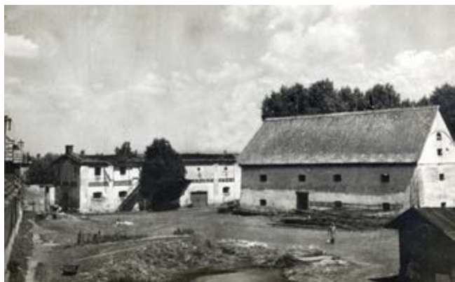
Špýchar a bývalá volovna