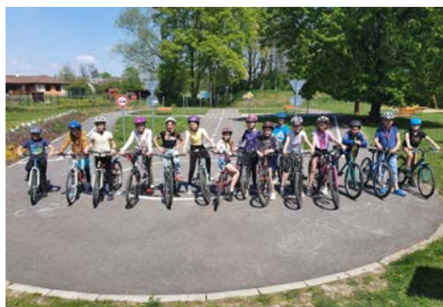
Dopravní hřiště u MŠ České Meziříčí

Vedení ZŠ, vedení MŠ i výbor SRPZŠ kroužek dopravní výchovy podporuje. Díky tomu mohli účastníci dopravního kroužku navštívit 26. 4. dopravní hřiště v RK, využít dopravní hřiště u MŠ, občerstvit se a získat odměnu za vynaložené úsilí na cyklovýletě a za ZŠ si užít jízdu zručnosti s novými překážkami.