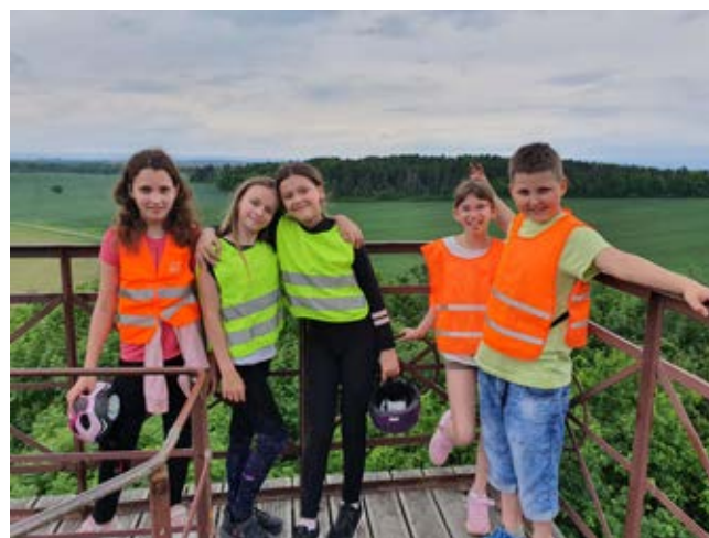
Rozhledna v Libníkovcích