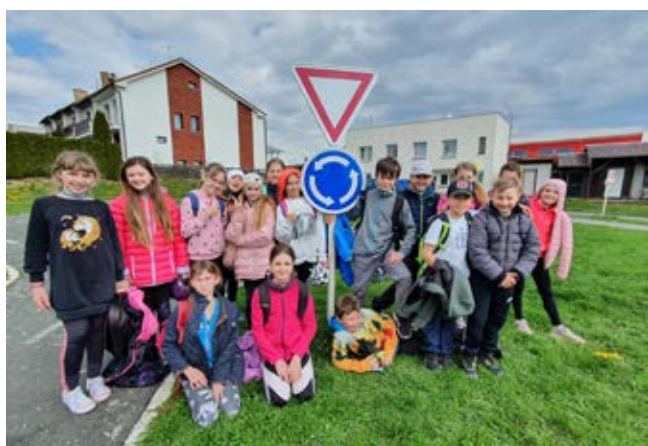
Dopravní hřiště v Rychnově n. Kn.

Vedení ZŠ, vedení MŠ i výbor SRPZŠ kroužek dopravní výchovy podporuje. Díky tomu mohli účastníci dopravního kroužku navštívit 26. 4. dopravní hřiště v RK, využít dopravní hřiště u MŠ, občerstvit se a získat odměnu za vynaložené úsilí na cyklovýletě a za ZŠ si užít jízdu zručnosti s novými překážkami.