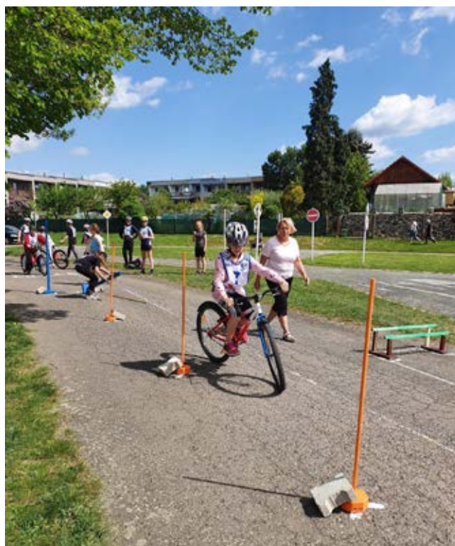
Jízda zručnosti na dopravním hřišti v Rychnově n. Kn.