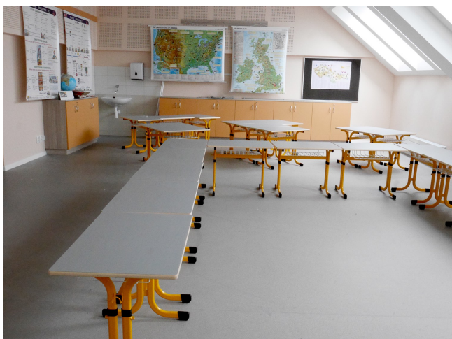
Jazyková učebna v nově vzniklých prostorech půdní vestavby

V lednu 2020 se děti vrátily zpátky opět do školních lavic. Výuka probíhala v nově zrekonstruovaných prostorách školy, jež byly uvedeny do provozu v září 2019. Na počátku kalendářního roku byla také v rámci celého projektu dokončena půdní vestavba a tyto nově vzniklé prostory byly v únoru téhož roku řádně zkolaudovány. Součástí tohoto velkého projektu bylo také vybavení nově vzniklých i zrekonstruovaných prostor novým nábytkem a moderními výukovými pomůckami. Tyto části projektu byly od