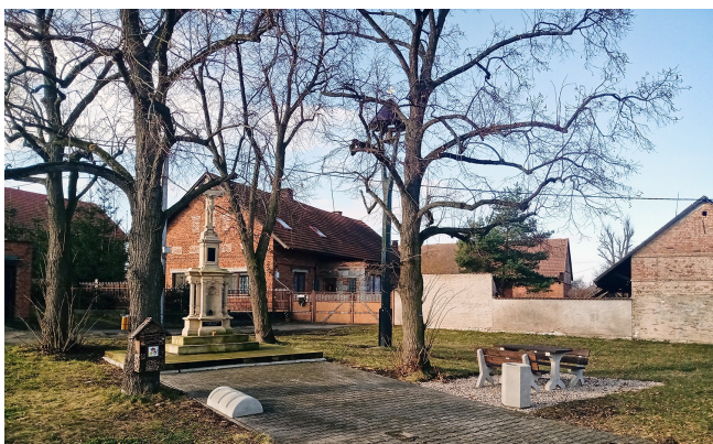
Nové lavičky pod lipami u zrekonstruovaného křížku

Ale i přesto se v uplynulém roce v našich Skršicích odehrála řada důležitých a přínosných projektů. Za zmínku jistě stojí nově vybudované odpočinkové místo s posezením pod lipami ve středu obce u křížku, který byl v loňském roce pečlivě zrenovován a společně se zvoničkou se stal chloubou naší obce.