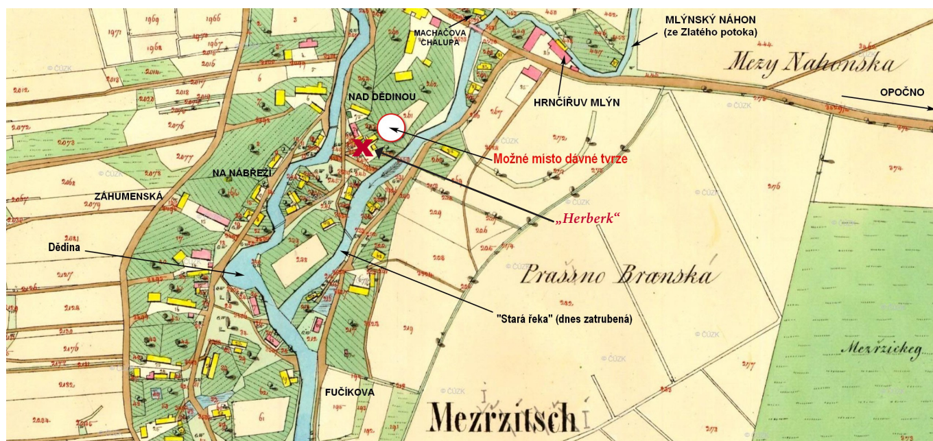
Detail z originální mapy Stabiliho katastru z r. 1844, kde je zakreslen soutok dvou řek

lečnou cestou vytvářejí zajímavý trojúhelník. Poblíž soutoku stávala krčma, nazývaná Herberk (nyní čp. 280 - býv. Větvičkova chalupa). Zde se přepřahali unavení a vyhládlí koně, také jezdcí a kočí mohli něco pojíst a třeba se i vyspat. Nedaleko od Herberku byl brod, což byla jediná možnost jak se dostat na