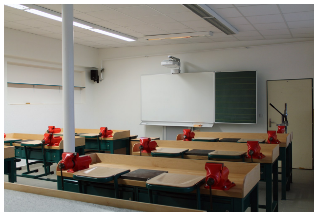
Učebna školních dílen prošla svojí rekonstrukcí v počátku projektu v létě 2019