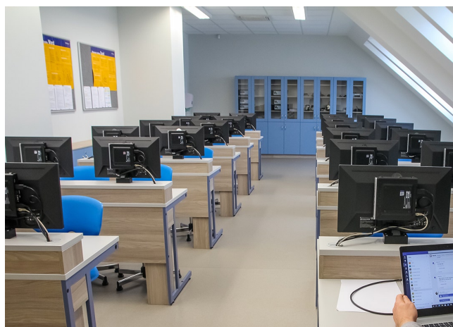
On line výuka informatiky probíhá z nových prostor půdní vestavby

počátku velmi opožděné kvůli nepostupujícím výběrovým řízením. Výuka ve škole nebyla v této době nijak ovlivněna, neboť se vyučovalo v rekonstruovaných stávajících učebnách, kde byl použit původní nábytek.