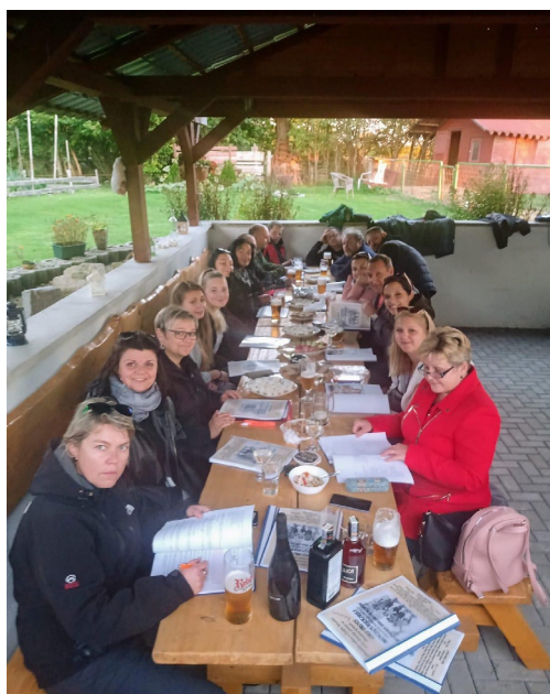
Čtená divadelní zkouška Tří mušketýrů