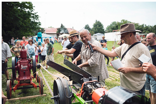
1. ročník Skršické brázdy

Ani v kulturní oblasti Skršice nezůstaly pozadu. O prázdninách jsme se opravdu nenudili. Dobré jídlo, pití a živá hudba, to byl zábavný a navíc poučný 1. ročník akce s názvem „ Skršická brázda “. Účastnili se jej místní ale i přespolní nadšenci zemědělské techniky, kteří oprášili a naleštli své vzácné stroje a předvedli mnohdy již dávno zapomenuté zemědělské řemeslo. Soutěže byly příjemnou tečkou tohoto programu.