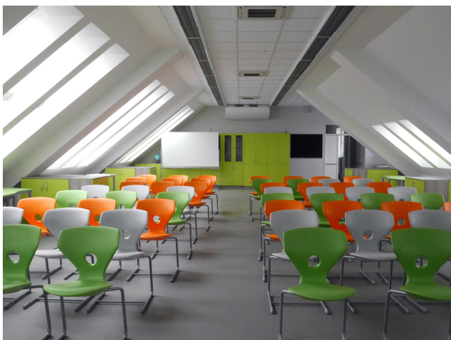
Environmentální učebna v půdní vestavbě bude sloužit také sboru Mezissimo k pěveckým zkouškám

Na začátku povídání o životě naší školy bych se hned v úvodu vrátila o rok zpátky. Tehdy, na prahu nového roku 2020 po návratu z vánočních svátků zpátky do školy, jsme všichni přáli našim žákům hodně zdraví, štěstí, mnoho školních úspěchů, pěkných známek a spoustu kamarádů kolem sebe. A právě v této době si nikdo z nás vůbec nedokázal představit, jak se nám v roce s tak krásně vypadajícím letopočtem (2020) změní naše běžné, naprosto samozřejmé denní činnosti, jako je třeba školní docházka, cesta do zaměstnání nebo na nákup.