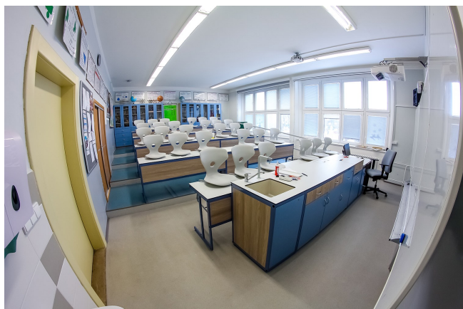
On line výuka informatiky probíhá z nových prostor půdní vestavby

střednictvím monitoru počítače, notebooku, tabletu či chytrého mobilního telefonu.