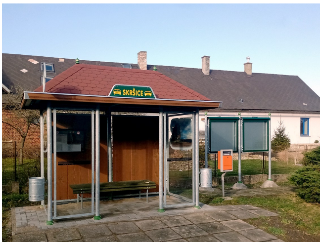
Nová autobusová zastávka

Také staré autobusové zastávky byly nahrazeny novými, o jejichž současné podobě občané Skršic měli možnost sami rozhodnout. A nejen o nich obyvatelé v loňském roce rozhodovali, ale také o budoucí podobě skršického erbu, která ovšem ještě není definitivní a tak zůstává prostor pro další návrhy a diskuze k tomuto tématu.