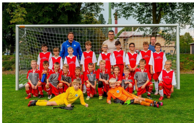
OFS Rychnov nad Kněžnou