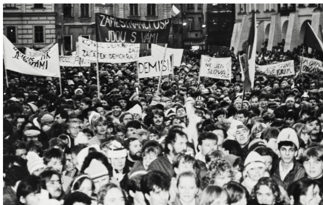
Generální stávka 27. 11. 1989 v Hradci Králové

Od tohoto dne se nejprve studenti, později i pracující lidé pravidelně scházeli k protestům a demonstracím, které probíhaly na tehdejší Žižkově náměstí (dnešní Velké náměstí) každý den. Lidé přicházeli s transparenty, četli zprávy o dění v Praze, zněla hesla jako „Havel na Hrad, Odejděte, Svobodné volby, Stranické pijavice pryč a nikdy více, Prior Hradec je s vámi“...