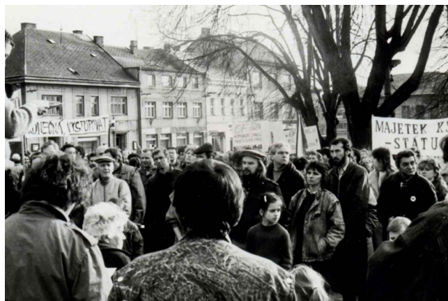
Listopad 1989 v Rychnově nad Kněžnou

Oproti tomu v Rychnově nad Kněžnou se začalo demonstrovat až ve čtvrtek 23. listopadu 1989 odpoledne. Jeho obyvatelé měli pouze mlhavé informace o dění v Praze. Postupem času ale dostávali jasné zprávy hlavně prostřednictvím Hlasu Ameriky. Mezi prvními, kteří na celou situaci zareagovali, byli studenti gymnázia, kteří se 21. a 22. listopadu sešli k mítinku ve školní tělocvičně a následně se vydali do ulic.