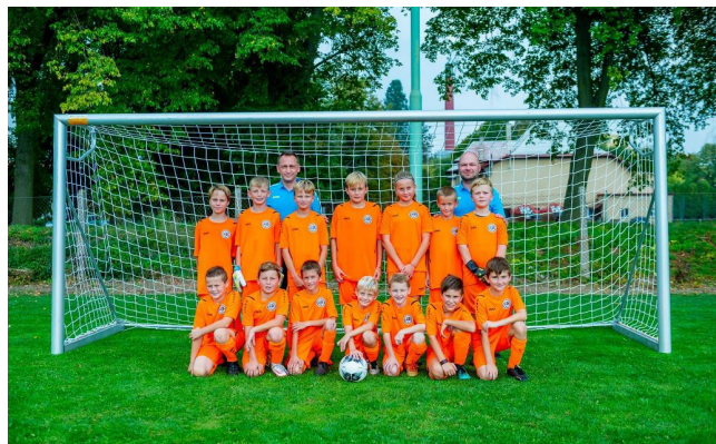
OFS Hradec Králové