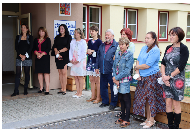
Den otevřených dveří 29. 9. 2021