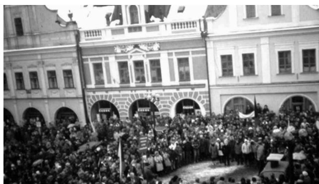
Listopad 1989 v Rychnově nad Kněžnou