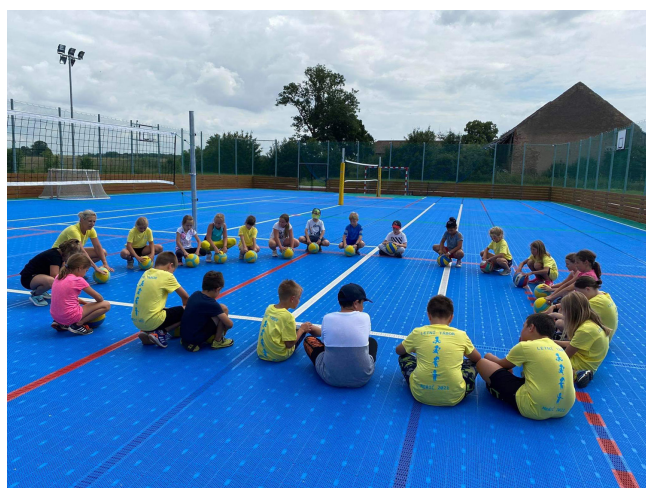
Školní příměstský tábor, červenec 2021

Děkuji tímto všem rodičům, kteří byli nápomocni svým dětem při on-line výuce, a také děkuji všem pedagogům za jejich práci.