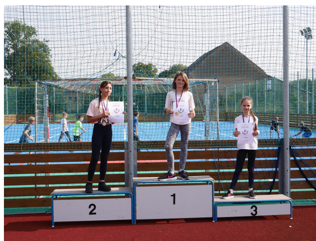
Běh Emila Zátopka

Žáci 8. a 9. ročníku se zase účastnili Školské výstavy v Rychnově n. Kn., kde se seznámili s nabídkou místních škol pro další vzdělávání. Druháčci v rámci rozvoje svých čtenářských dovedností navštívili místní knihovnu, kde se kromě jiného seznámili s možností půjčování knížek ve svém volném čase.