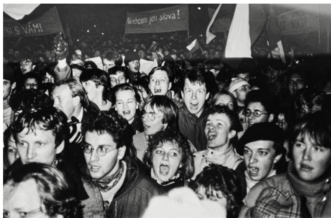
Protestující studenti v Hradci Králové

Hradec Králové - psal se 17. listopad roku 1989 a díky informacím ze Svobodné Evropy či Hlasu Ameriky tušili lidé ještě téhož večera, že Praha zažívá jednu z nejdůležitějších událostí novodobé historie. V návaznosti na tyto události, přijíždí následujícího dne několik studentů z Prahy do Hradce a 20. listopadu 1989 vzniká na vysokoškolských kolejích Na kotli studentský stávkový výbor. Ten se večer přesouvá před tehdejší Divadlo Vítězného února (dnešní Klicperovo divadlo). Studenty přišli podpořit také divadelníci, kteří byli odhodláni vstoupit do stávky a tímto krokem v podstatě odstartovali revoluci v Hradci Králové.