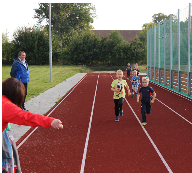
Běh Emila Zátopka

Mezi akce, jichž se měli žáci možnost účastnit, jistě stojí za zmínku projektový den Běh Emila Zátopka, jež škola uspořádala na konci září. Žáci si mohli v rámci této akce poměřit své fyzické síly se svými vrstevníky v běhu a po delší době si opět zasportovat na místním hřišti.