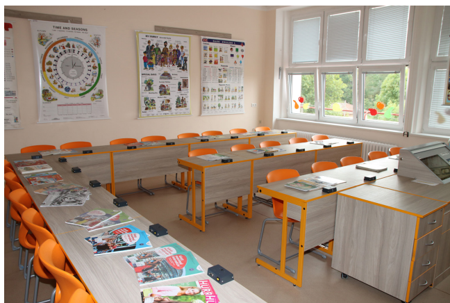
Den otevřených dveří 29. 9. 2021

ří za účelem zhlédnutí nově vybudovaných prostor školy.