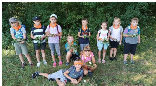
Pohoda v přírodě

a spolupracovat s ostatními. Táborníci se dozvěděli také spoustu věcí o přírodě kolem nás a životě v ní.