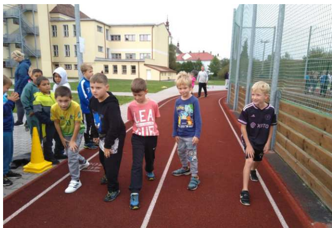
Chvilka napětí před závodem chlapců ze 2.A