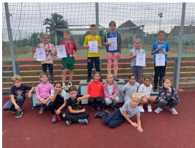
Žáci ze 3.A po doběhnutí svého závodu