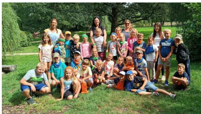
Táborníci na výletě do Častolovic

Příměstský tábor je skvělou příležitostí, jak dětem zajistit nejen zábavu během prázdninových dnů a