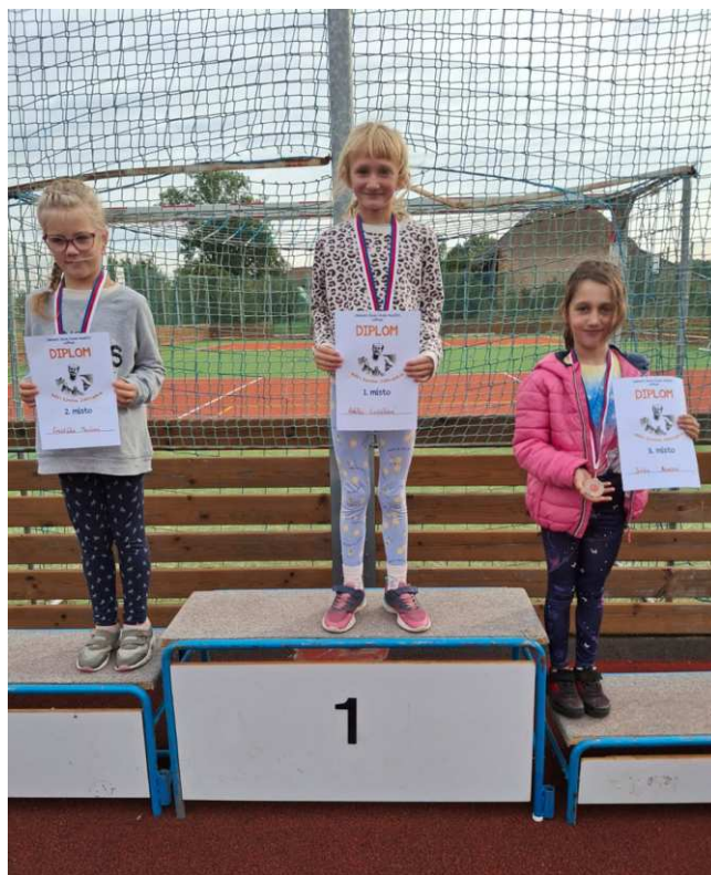
Nejrychlejší běžkyně ze 2.B