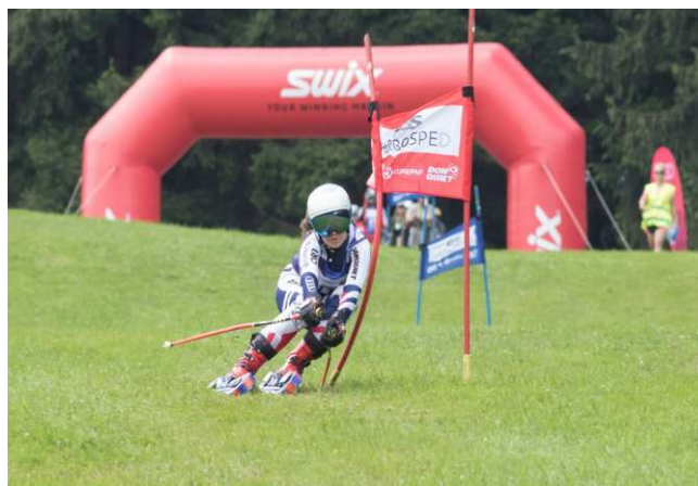
Na trati GS

V následujících letech Eliška dominovala závodům světového poháru a v roce 2024 se jí podařilo získat křišťálový globus již potřetí v řadě. V posledním závodě v rakouském Rettenbachu, který byl nesmírně náročným díky velmi tvrdému povrchu, si připsala další tři medaile, když svedla vyrovnaný souboj s rakouskou závodnicí Larou Teynor.