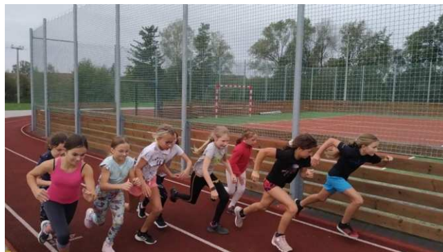
Děvčata ze 4.A se do svého závodu pustila s velkou vervou.