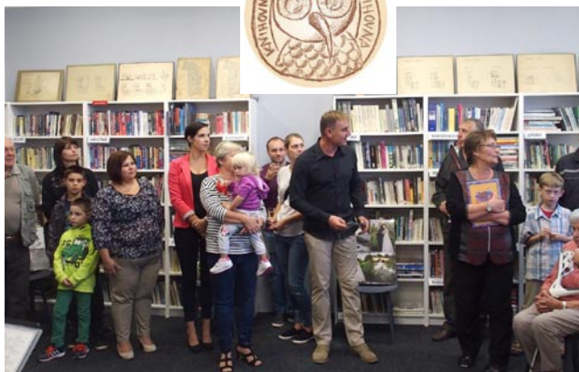
Slavnostní otevření knihovny 8. 9. 2019