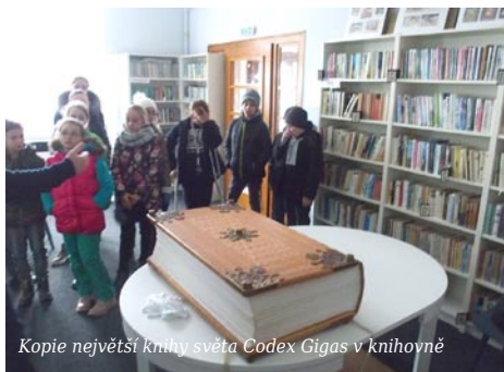
Kopie největší knihy světa Codex Gigas v knihovně