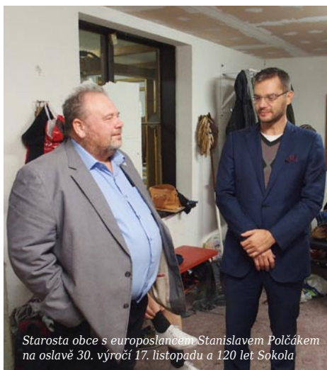
Starosta obce s europoslancem Stanislavem Polčákem na oslavě 30. výročí 17. listopadu a 120 let Sokola