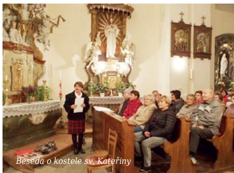
Beseda o kostele sv. Kateřiny