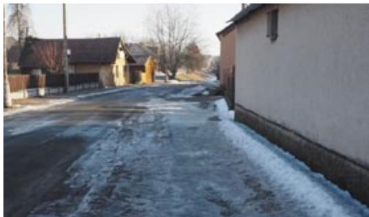
Projekt je spolufinancován z prostředků EU

Obec České Meziříčí podala v loňském roce žádost o dotaci do Integrovaného operačního programu, výzvy č. 53 Udržitelná doprava - integrované projekty SCLLD - SC 4.1 a výzvy č. 3 IROP „MAS Pohoda - IROP - Bezpečnost dopavy I“ na projekt „ Zvýšení bezpečnosti dopavy v centru obce České Meziříčí a zajištění bezpečné přístupové chodecké trasy do ZŠ České Meziříčí “. Projekt byl schválen k financování, proto bylo přistoupeno k jeho realizaci s cílem zvýšit bezpečnost chodců a uživatelů veřejné dopavy a ve svém důsledku i bezpečnost uživatelů automobilové dopavy v ulici Zahradní a Jana Výravý. Stávající stav nezajišťuje bezpečný pohyb chodců, zvláště žáků, po komunikaci, kterou využívají osobní i nákladní auta vč. traktorů. V rámci kontroly byla tato komunikace vyhodnocena jako nebezpečná. Přihlehlý chodník není odvodněn, výšky obrubníku je nedostatečná, v zimě se tvoří nebezpečné náledí, které znemožňuje pohyb chodců. Nový bezbariérový chodník bude napojen na již zrealizovaný přechod přes okresní komunikaci III/30815 u obchodů a po dokončení vznikne bezpečná chodecká trasa zvláště pro žáky Základní školy.