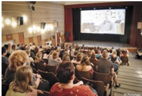
Foto z oslav výročí sboru

V nedávné minulosti se sbor zúčastnil zájezdu do partnerského města Velké Meziříčí, zpěváci dále zaplivali na velkých oslavách 80. výročí naší školy a ve spolupráci s Polyfonním sdružením Nové Město n. Met. uvedli v kostele sv. Kateřiny Českou mši vánoč-