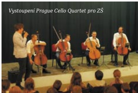
Vystoupení Prague Cello Quartet pro ZŠ