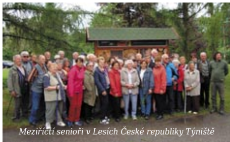
Meziříčtí seniři v Lesích České republiky Týniště