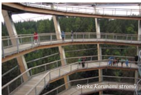
Stezka Korunami stromů