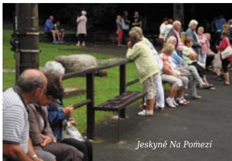
Jeskyně Na Pomezí