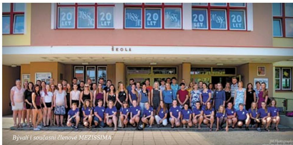
Bývalí i současní členové MEZISSIMA

ní J. J. Ryby. Rok 2016 byl ve znamení operek Zdeňka Svěráka. A rok 2017 byl pro Mezissimo opět rokem zlatým. Z krajské přehlídky si zlaté pásmo přivezlo nejen Mezissimo, ale také přípravný sbor Pramínek.