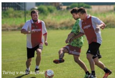
Turnaj v malé kopané