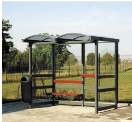
Nová autobusová čekárna v Záhumenské ulici

V další etapě bude realizován nový chodník naproti zastávce jako zakončení chodkové trasy z lokality V Poli přes Mochovskou ulici okolo Zemspolu na Zahumenskou ulici.