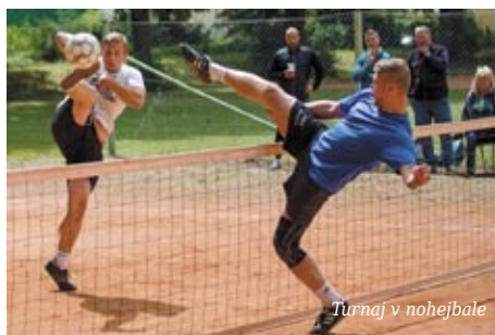
Turnaj v nohejbale