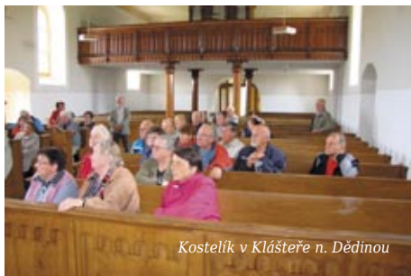
Kostelík v Klášteře n. Dědinou