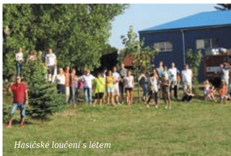
Hasičské loučení s létem