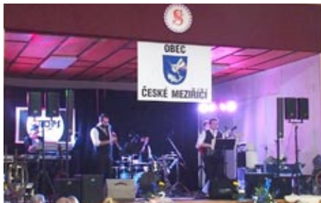
Obecní ples, 14.1.2017