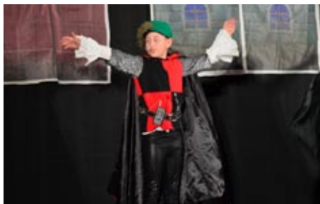
Meziříčská kulturní bžunda II, 25.2.2017