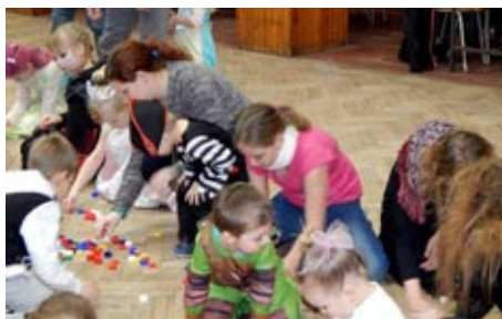
Dětský karnival, 2017