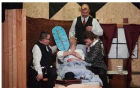
Bylo nás 5, 25.2.2017