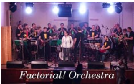
Meziříčská kulturní bžunda II, 25.2.2017