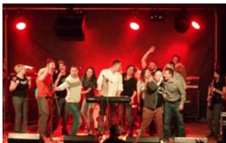
Meziříčská kulturní bžunda II, 25.2.2017