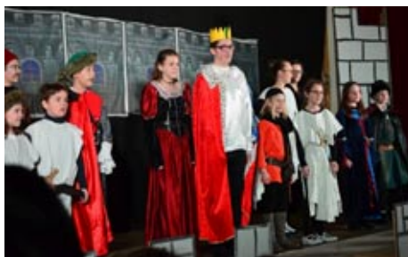
Kino: Noc na Meříčskéjně - premiéra 5.2.2017