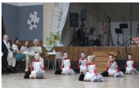
Školský ples, 10.2.2017