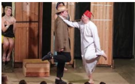
Bylo nás 5, 25.2.2017