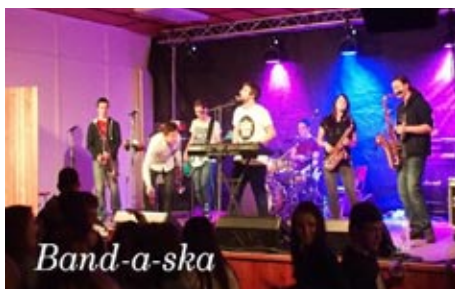
Meziříčská kulturní bžunda II, 25.2.2017