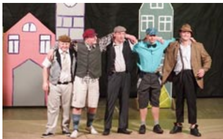
Bylo nás 5, 25.2.2017