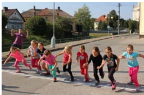
Běh E. Zátoka, září 2016

Ve školním roce 2016-2017 bylo otevřeno na naší škole celkem 12 tříd. Osm z nich patří 1. stupni a 4 jsou určeny pro stupeň vyšší. Na škole v letošním roce působí 19 učitelů, 2 vychovatelky školní družiny, 1 asistent pedagoga a 8 nepedagogických pracovníků. Školu navštěvuje nyní asi 250 dětí, přičemž tento počet se během roku mění. Žáci místní školy mohou navštěvovat více jak desítku zájmových aktivit, které vedou místní učitelé nebo externí pracovníci. Pro větší motivaci dětí se pedagogové snaží zapojovat žáky do různých soutěží, aby měli možnost porovnat své vědomosti a dovednosti se svými kamarády z jiných škol. Škola také pořádá různé projektové dny na podporu zájmu dětí o kulturní a společenské dění. Již tradičně se na naší škole konal v říjnu projektový den Halloween a v měsíci prosinci měly děti možnost účastnit se projektu Českomeziříčské Vánoce. Pro rozvoj fyzické zdatnosti žáků se děti účastní každoročně Běhu E. Zátoka.