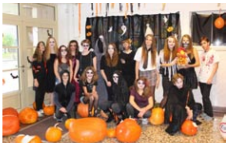
Projektový den Halloween, říjen 2016

I v letošním školním roce mají žáci možnost účastnit se různých sportovních her a soutěží. Žáci 5. třídy se na podzim zúčastnili dopravní soutěže mladých cyklistů, kde skončili na 7. a 8. místě z 19 družstev. Dívky ze 7. třídy byly na přespolního běhu, chlapci od 6. do 9. třídy si poměřili své síly ve florbalu v Dobrušce a později v Rokycině v Orł. horách,