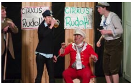
Bylo nás 5, 25.2.2017