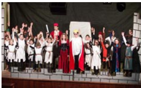
Meziříčská kulturní bžunda II, 25.2.2017