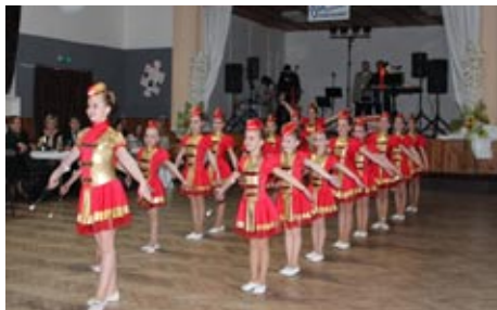
Školský ples, 10.2.2017