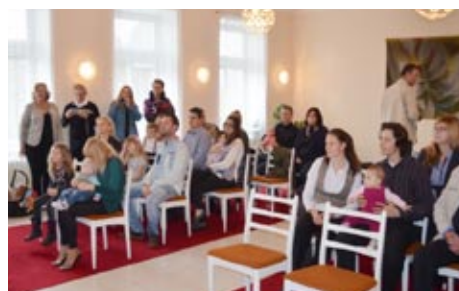
Vítání občánků, 28. října