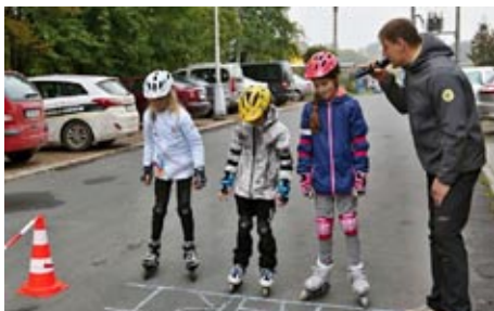
SPOLU V POHYBU, 23. září