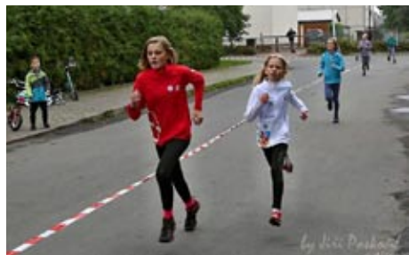
SPOLU V POHYBU, 23. září