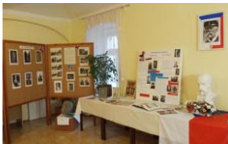
Výstava k 80. výročí úmrtí TGM, 4. října