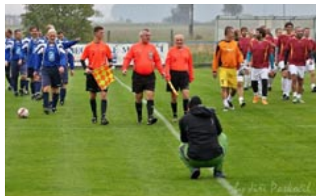
SPOLU V POHYBU 23. září - utkání starých gard