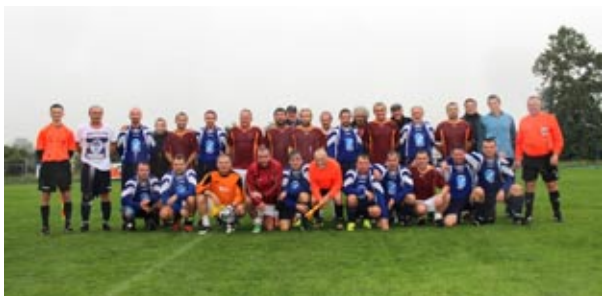
Staré gardy Č. Meziříčí a Opočna na sokolské akci SPOLU V POHYBU