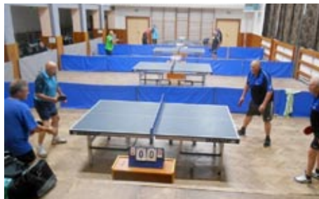
Přebor ČOS ve stolním tenisu seniorů, 9. září