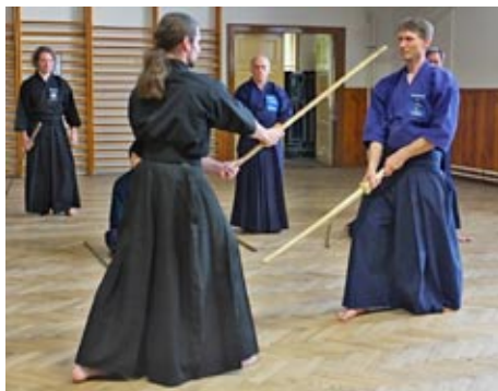
Seminář v sokolovně České Meziříčí

Druhou, velmi úspěšnou akcí, která sice nebyla soutěžní, byl Džódó seminář a Otevřený trénink reprezentace v Českém Meziříčí 2017. Druhý ročník semináře, který se konal v červenci, uspořádal sportovní klub Nozomi Dojo Hradec Králové. Orga-