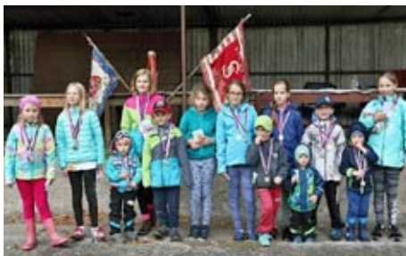
SPOLU V POHYBU, 23. září