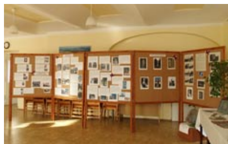
Výstava k 80. výročí úmrtí TGM, 4. října