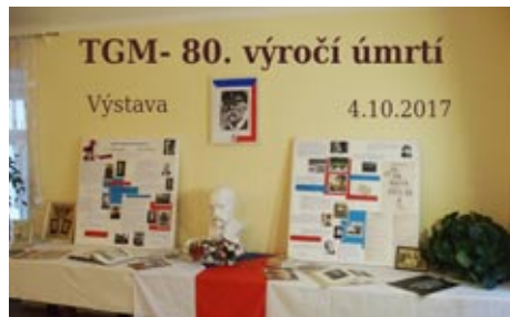
Výstava k 80. výročí úmrtí TGM, 4. října