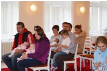
Vítání občánků, 28. října