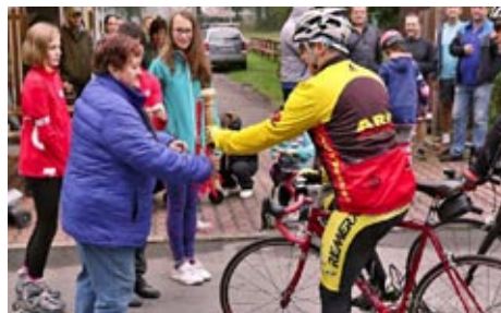
SPOLU V POHYBU, 23. září - akce na podporu XVI. Vsesokolského sletu 2018 - převzetí štafety z Opocna