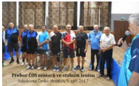
Přebor ČOS ve stolním tenisu seniorů, 9. září