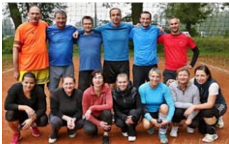
SPOLU V POHYBU 23. září - volejbal