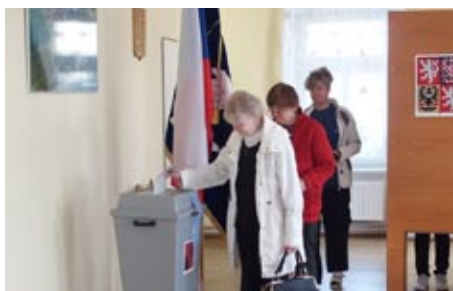
Volby do poslanecké sněmovny, 20. října